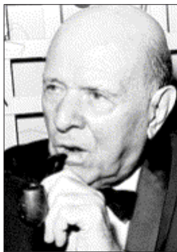
Pablo Casals 29-12-1876 † 22-10-1973

Tien jaar nam hij de tijd voor hij de suites voor het eerst voor een publiek uitvoerde. Het Spaanse Hof omarmde het unieke talent. Met een beurs van de koningin vertrok Pablo naar Brussel om zich daar aan het conservatorium verder te bekwamen.